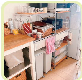
その他・・・シンク下や食器棚の横