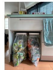
昨年導入した ゴミ袋フォルダー シンクの下に置いています

何気なくアンケートで「大きなゴミ箱はどこに置いていますか?」とお聞きしたのですが、「使っていない」という回答があり驚きました。私の中で大きなゴミ箱は使うものだと思っていたからです。頂いた回答を読んで、ゴミの集め方を工夫すれば、もしかすると必要ないものかもしれないと思うようになりました。ゴミ箱を洗うのが嫌で、プラゴミや空き缶用にはゴミ袋フォルダーを使い始めたのですが、可燃ゴミの大きなゴミ箱はキッチンに置いたままです。これを機会に大きなゴミ箱もなくせるか考えてみます。