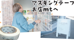
たまたま見つけたマスキングテープのお店mtへ