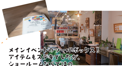
メインイベントのツール探検のクイズ! アイテムもステキでしたが、ショールーム探検ではの事例がたくさんあって新しい発見がありました!