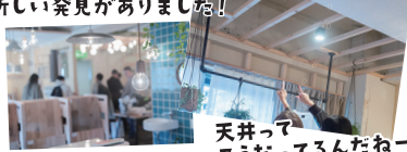
天井ってこうなってるんだねー