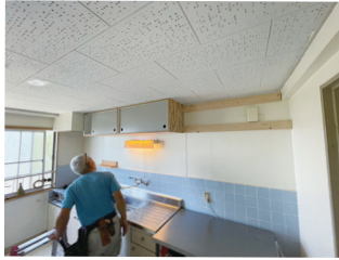
内面でも紹介した人気のTOOLBOXさんのアイテム

壁付けキッチン上部にTOOLBOX(ツールボックス)のラーチ吊戸棚を設置。吊戸棚の高さに合わせ、上下に2本の下地補強をしました。壁の端から端まで入れることで、強度が増します。余っているところにはお客様ご自身で収納グッズを付けられるとのことでした。